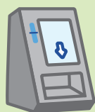
医療機関窓口の カードリーダー